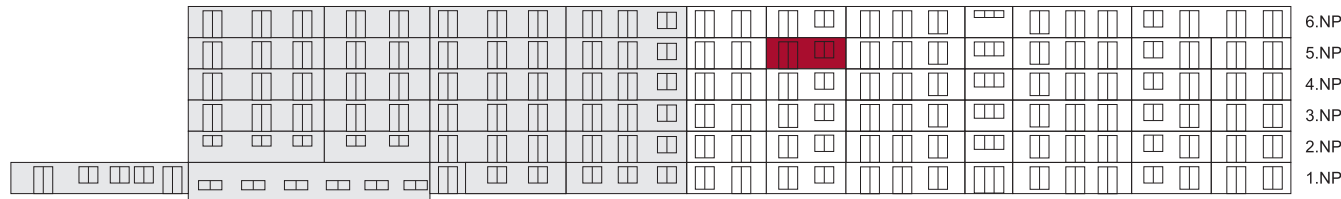
Jižní pohled na dům/ Building View - South side