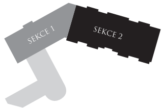
Schéma areálu | Chart campus