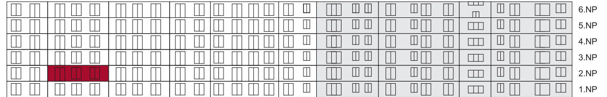
Severní pohled na dům/ Building View - North side