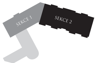
Schéma areálu | Chart campus