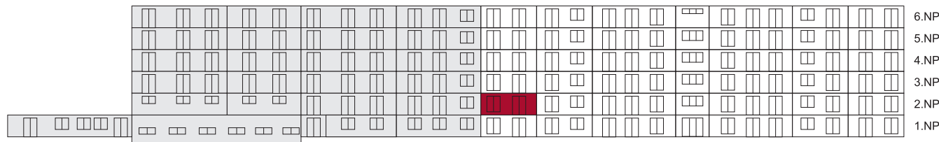
Jižní pohled na dům/ Building View - South side