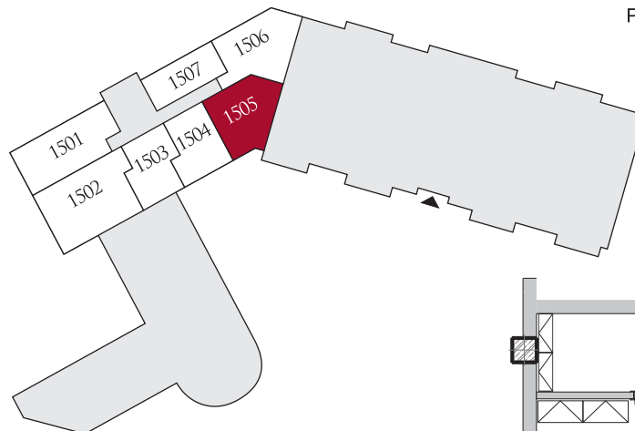
Půdorys podlaží | Floor plan