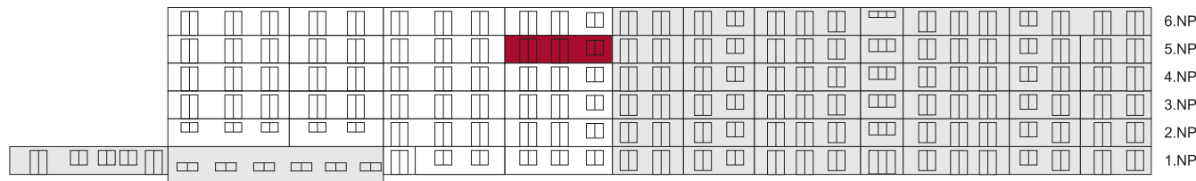
Jižní pohled na dům/ Building View - South side