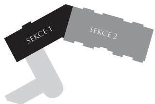
Schéma areálu | Chart campus