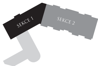
Schéma areálu | Chart campus