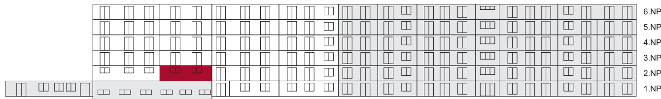
Jižní pohled na dům/ Building View - South side