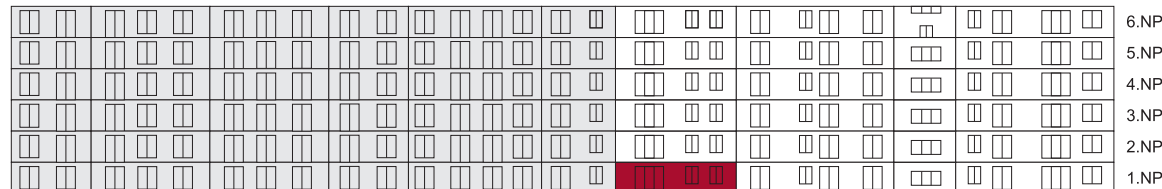
Severní pohled na dům/ Building View - North side